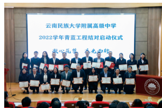
为培养和增强青年教师教育教学管理水平，充分发挥骨干教师的传帮带作用，营造互帮互学、共