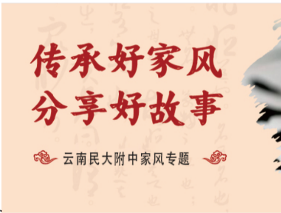
云南民大附中家风专题

“家风蔚然，国风浩荡”蔚然家风，育吾华夏。古语云：“家风正，则后代正，则国正。”在中华文化的语境里，蔚然家风始终感召着人们在残破的国土之境上穿越深山幽谷；在战火烽烟四起时纵横