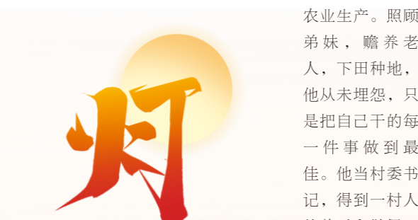
高2022级20班 何宛 指导教师：雷萍

爷爷是一家长子，自小机灵聪明的他本可以继续上学，却早早懂得帮家里分担压力，读完高小就加入了